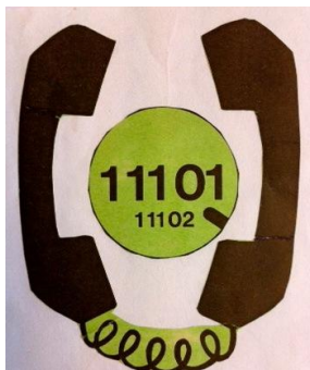
Erstes Plakat der TS

Herr Rückgauer von der kath. Kirchenpflege in Ravensburg trat dann - nach eigener Aussage - "mit einem Köfferchen" die Reise durch die Dekanate an, um für die Beteiligung an dem Projekt TelefonSeelsorge zu werben.